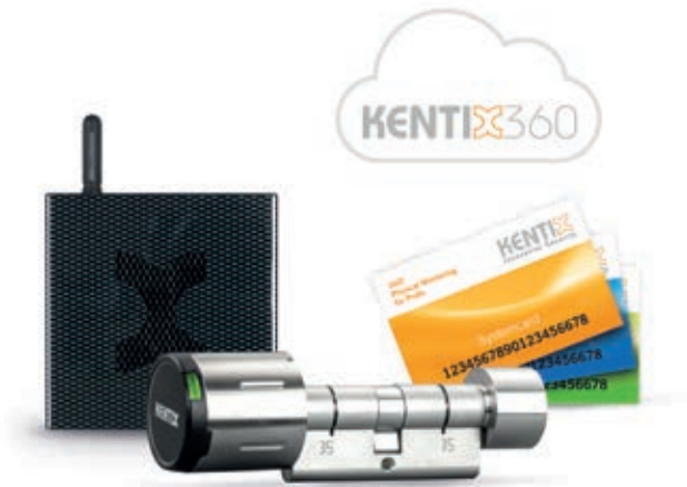
AccessPoint + Online Türknäuf + Masterkartensatz